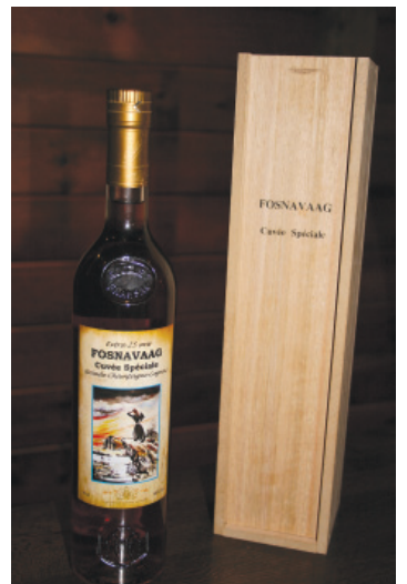
Etiketten er eit måleri av kunstnaren Arvid Urkegjerde.